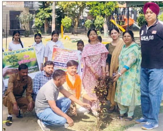
यमुनानगर। हरिप्रसाद पार्क में पौधरोपण करते प्रतिभागी।