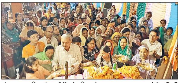
अंबाला। आरती कार्यक्रम में हिस्सेदारी करते श्रद्धालु।