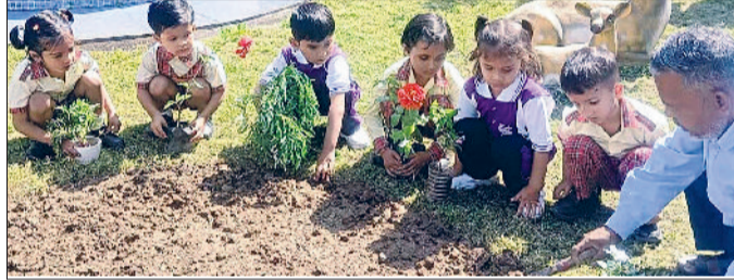
यमुनानगर। होली मंदर पब्लिक स्कूल में पौधरोपण करते हुए बच्चे।