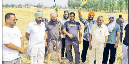
मुलाना। खेत में पोल लगाए जाने का विरोध करते किसान।

क्षेत्र में पावर हाउस से नई बिजली लाइन बिछाने के लिए लगाए जा रहे बिजली पोलों का किसानों ने जोरदार विरोध किया। किसानों ने मौके पर पहुंचकर पोल लगाने का कार्य रुकवा दिया और विभाग के खिलाफ नाजार्गी जताई। किसानों का कहना है कि इतनी लंबी बिजली लाइन खेतों के ऊपर से गुजरने पर आगजनी का खतरा बढ़ जाएगा, जिससे उनकी फसलों को भारी नुकसान हो सकता है। उन्होंने बताया कि गर्मियों के मौसम में अक्सर तारों में स्पार्किंग की घटनाएं होती हैं, जिससे खेतों में आग लगने की आशंका बनी रहती है। ग्रामीणों ने यह भी आरोप लगाया कि संबंधित विभाग ने पोल लगाने से पहले किसानों से कोई बातचीत नहीं की और न ही